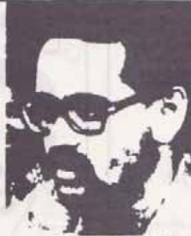
فدائی شهید رئیس هیئت مدیره و دبیر هیئت مدیره