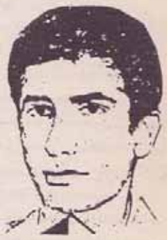
فدایی شهید - رفیق رحیم سعادی