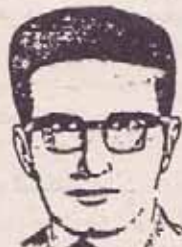
فدایی شهید رفیق فقور حسن پور