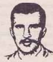
فدایی شهید رفیق احمد فرهودی