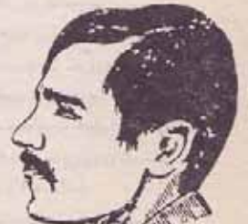
فدایی شهید رفیق جنیل انفرادی