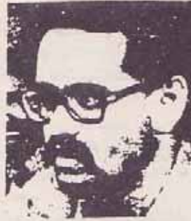
فدایی شهید رفیق توماج

در ۱۱ بهمن سال ۱۳۵۰ مجاهد کبیر شهید احمد رضایی یکی از برجستهترین کادرهای سازمان مجاهدین خلق ایران و اولین شهید این سازمان در راه استقلال دمکراسی و عدالت اجتماعی طی یک نبرد حماسی شهادت رسید. در ۲۹ بهمن سال ۱۳۵۲ دو تن از برجستهترین چهره‌های جنبش کمونیستی و انقلابی، دو فدایی رزمنده، خسرو گلرخ و کرامت الله دانشیان بدست مزدوران رژیم اعدام شدند.