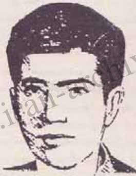
فدایی شهید رفیق مهدی اسحاقی

و بدین ترتیب جریان خائسانه موسوم به اکثریت ، در جنبه ارتجاع قرار گرفت و ماهیت اپورتونسم ضد انقلابی اش را به نمایش گذاشت . از طرف دیگر جریان اقلیت که از مواضع انقلابی در مقابل رژیم اکثریت دفاع میکرد ، در جریان پیشرفت و انکشاف مبارزه طبقاتی و به سوازت پیشرفت و تعمیق انقلاب ، بشدت از اوضاع و احوال ناامید پذیرفت . شکل‌گیری گروه‌بندیهای سیاسی - ایدئولوژیک در درون اقلیت ، نمیتوانست جدا از تحولات مهمی که در جامعه ما جریان داشت صورت گیرد . مهمترین رویدادی که منجر به شدت گیری نشانه‌های درونی جریان اقلیت گردید ، چرخش تاریخی ۳۰ خرداد سال ۶۰ بود . جریانی که ما آنرا نمایندگی میکردیم ، همچنان بر مواضع اصولی و انقلابی پانشاری می‌کرد و خواستار اتخاذ مشی انقلابی مسلحانه و حمایت از شورای ملی مقاومت که توسط مجاهدین خلق ایجاد و رهبری میشد بود . جریان سگتاریستی درون سازمان علیه