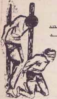
در برابر تندروی ایستند خانه را روشن می کنند و می میرند.

دفتر سازمان مجاهدین خلق ایران در تاریخ ۱۰ مهر اسامی اطلاعیه ای تحت عنوان " طرفداران احمد خمینی به خلعید از باند رفسنجانی فرا می خوانند" بشرح زیر صادر نمود. " روز چهارشنبه ۲۷ سپتامبر (شهر) مجلس ملایان شاهد تعرض گسترده نمایندگان وابسته به جناح مخالف رفسنجانی علیه شخصی وی و کابینه اش بود. در جلسه مزبور صادق خلغالی که به نمایندگی از جناح موسوم به خط امام سخن می گفت فاش ساخت که احمد خمینی اخیراً نسبت به مواضع تصفیه مخالفان در دستگاه های حکومتی به رفسنجانی هشدار داده و او را از این کار باز داشته است. خلغالی که از احمد خمینی به عنوان " کانون و آتش نشان" مخالفت با رفسنجانی یاد می کرد از موضع او تقدیر نمود و ضمن اظهار اینکه " دستی که برای زدودن باران امام در این مملکت فعالیت می کند، باید بهر طریق قطع شود" در یک اشاره نه چندان یوشیسته خواستار خلعید از رفسنجانی شد. او همچنین گفت جناح خط امام برخی از چهره های شناخته شده نظیر موسوی، محتشمی و خوشبینی ها که در جریان تحولات اخیر از مقام های پیشین خود برکنار شده اند را " در یک در صفحه ۲