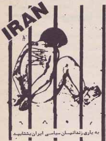
به یاری زندانیان سیاسی ایران بشتابید