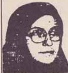
فدایی شهید ارشاف ربیعی

۱۳۶۰/۱۱/۱۹ - شهادت انقلابی کبیر، مجاهد قهرمان خلق موسی خیابانی شامل زن انقلابی مجاهد خلق، اشرف ربیعی و ۱۷ تن دیگر از کادرها و اعضای سازمان مجاهدین خلق ایران در یک درگیری حماسی با مزدوران رژیم خمینی