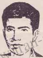
فدایی شهید رفیق مهدی آسمانی در عکس ۹