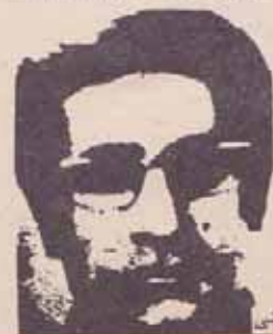
فدایی شهید قاسم سیادتی

۱۳۵۷/۱۱/۲۲ - در جریان قتل مسلحانه مردم تهران، فدایی خلق بابک سلایی در حمله به یادگان ششرت آباد فدایی خلق خسرو پناهی در حمله به کلانتری ۶ تهران فدایی خلق محمد علی ملکوتیان (یکی از چهره های انقلابی زندانیان رژیم شاه) در حمله به یادگان جمشیدیه ونیز رفیق فدایی، قاسم سیادتی عضو مرکزیت سازمان چریک های فدایی خلق ایران در جریان فتح مرکز رادیو ایران، شهادت رسیدند.