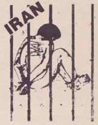
به یاری زندانیان سیاسی ایران بشنابید

دفتر مجاهدین خلق ایران - بغداد ۹ ژانویه ۹۰