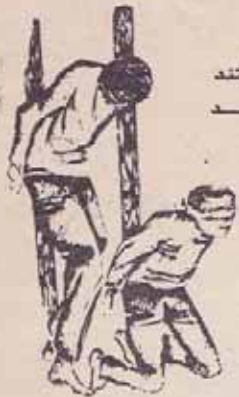
در برابر تنه می ایستند خانه را روشن می کنند و می میرند.