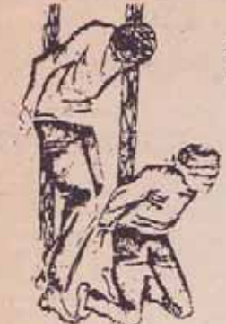
دریای تکریمی ایستاد خانه را روشن می کند و می میرد