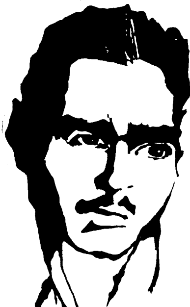
گرامی باد خاطره