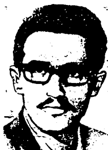
مجاهد شهید احمد رضایی

۱/۱/۱۲۵۰ - شهادت مجاهد کبیر احمد رضایی یکی از برجسته ترین کادرهای سازمان مجاهدین خلق ایران در یک درگیری حماسی بامزدوران رژیم شاه (اولین شهید مجاهد خلق)