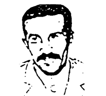
فدایی شهید رفیق

۱/۱/۱۲۵۰ - شهادت مجاهد کبیر احمد رضایی یکی از برجسته ترین کادرهای سازمان مجاهدین خلق ایران در یک درگیری حماسی بامزدوران رژیم شاه (اولین شهید مجاهد خلق)