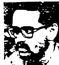
فدایی شهید رفیق توماج