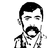
فدایی شهید رفیق مسعود رحمتی