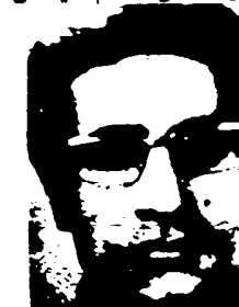
فدایی شهید رفیق