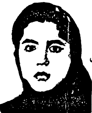
★ رفیق فدایی فاطمه محمدی

در پی شکوفایی مقاومت، و تکمیل ابزارهای لازم، برای سرنگونی رژیم ضد بشری خمینی، خانم مریم رجوی از طرف شورای ملی مقاومت ایران برای ریاست جمهوری دولت موقت آینده ایران انتخاب شد. این انتخاب و تأثیرات بزرگ آن در بین زنان، دلیل آنست که الترناتیو رژیم خمینی در مقابل سرکوب و حشیانه زنان کشور بطور کامل از حقوق زنان کشور برای آزادی و شکوفایی دفاع و تلاش می کند تا با سرنگونی رژیم ضد بشری آخوندی، استعدادهای انباشته شده زنان کشور را شکوفاسازد. بانومریم شایسته ترین پاسخ به مقاومت و مبارزه زنان کشور ما و به تمام کسانی است که برای دمکراسی و سازندگی مبارزه می کنند. اگر شرط آزادی جامعه و به تبع آن شرط آزادی مردان، آزادی زن است و شرط آزادی زن در گام اول به رسمیت شناختن حقوق مساوی زن و مرد در تمام سطوح است، شورای ملی مقاومت ایران با این انتخاب تهاجم کامل بر تمام بنیادهای فکری رژیم آخوندی و مرتجعین دیگر، راه را برای آزادی مردم ایران می گشاید.