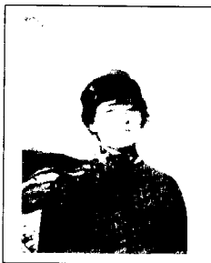
فدایی شهید رفیق نزهت روحی آهنگران

"من آن دریای خروشانم در جهان من آنم که خیر دهم از آزادی" (۲)