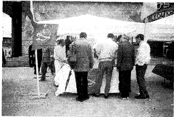
سر روی یک پلاکارد بزرگ نوشته شده بود: تحریم سراسری انتخابات ریاست جمهوری از تجماع از سوی مردم

فعلان سازمان چریکهای فدایی خلق ایران در این تظاهرات فعالانه شرکت داشتند و میز کتاب، نشریات و نوارهای سازمان مورد استقبال شرکت کنندگان قرار گرفت.