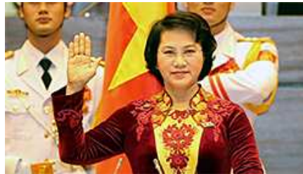
به این سو معاون رییس مجلس ویتنام بوده است.

نگان که تاکنون پستهای مختلفی داشته، از پنج سال