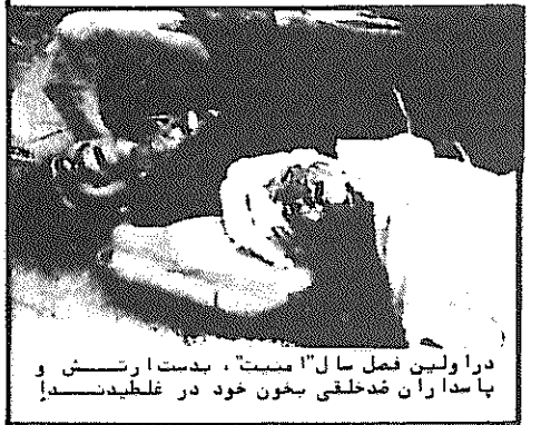
درا اولین فصل سال "منیت" بدست ارتش و پاسداران ضد خلقی بخون خود در غلطیدند!