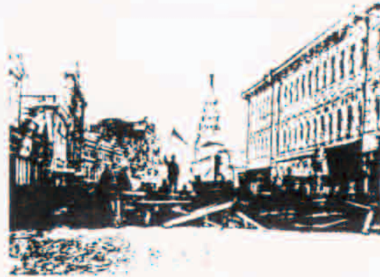
بازار تهران در روزهای اخیر