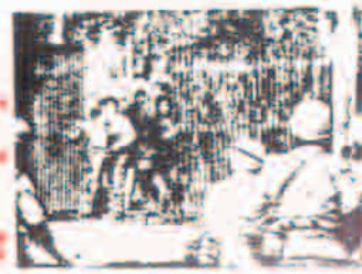
گروهی از افراد در یک جلسه یا کلاس آموزشی.

این بخش از مقاله به بررسی تأثیرات اقتصادی و اجتماعی سیاست‌های دولت می‌پردازد. تأکید بر نیاز به تغییرات اساسی در سیستم اقتصادی دارد.