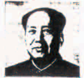
پیکار در راه آزادی ملت‌ها

این تصویر از یک روزنامه ۱۹۵۰ میلادی است که در آن گروهی از دانشجویان در حال مطالعه و بحث در مورد مسائل روزگار است. این صحنه نشان‌دهنده فعالیت‌های فرهنگی و آموزشی در آن زمان است.