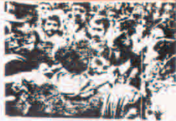
گروهی از فعالان اجتماعی در یک تجمع عمومی.

این تصویر نشان‌دهنده یکی از چهره‌های برجسته در جنبش‌های اجتماعی ایران است. او در پی مبارزه با استبداد و برای برقراری عدالت اجتماعی تلاش کرده است.