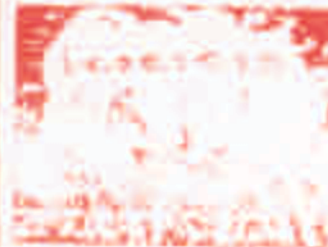
تصویری از یک انفجار یا آتش‌سوزی در یک منطقه شهری.

در حالی که دولت با شعار توسعه و رفاه می‌تواند مردم را فریب دهد، اما در عمل با افزایش فقر و بیکاری مواجه می‌شود. این امر نیازمند یک برنامه‌ریزی دقیق و اجرای صحیح است.