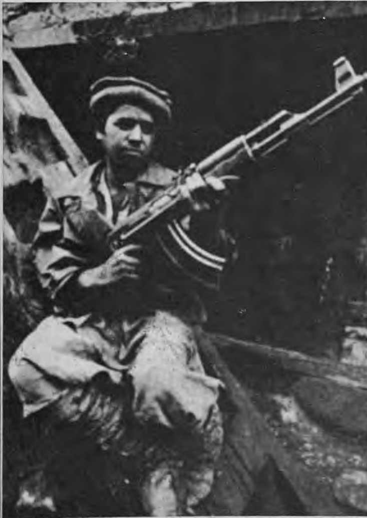
با اینکه بیش از ۱۳ سال ندارد، به مجاهدان پیوسه و در نبرد شرکت کرده و این کلاشینکف را بدست آورده است.

تصفیه‌های بی‌دری که آخرین آن بیش از سی خلیان نیروی هوائی و افسران دیگر را شامل میشود، نیروهای مسلح افغانستان را بیش از پیش به روسها وابسته ساخته است. خیابانان روسی بطور معمول جتها و هلیکوپترهایی را از باند هوائی جلال‌آباد به پرواز در می‌آورند. این خلیانان در حملات هوائی تلافی جویانه علیه شهر شورش زده هرات در ماه مارس شرکت داشتند.