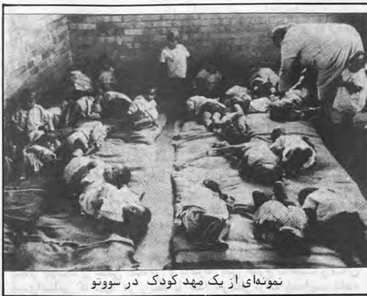
نمونه ای از یک مهد کودک در سووتو