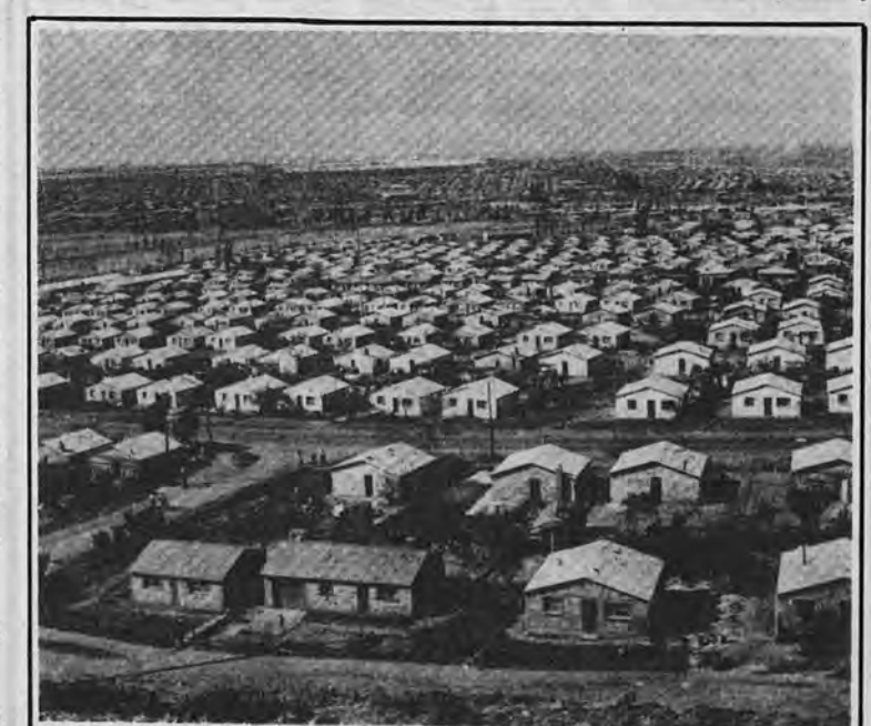
نشانه های از عدالت سفید پوستان

در نتیجه این شرایط سختی که بر زندگی مردم سووتو حاکم است و از سیاست تبعیض نژادی ناشی میشود تعداد مردان در سووتو روز بروز کاهش میابد زیرا بسیاری از آنها به انقلابیون میپیوندند گروهی ناپدید میشوند و گروهی دیگر یکدیگر را می کشند. این مسئله سبب شده است که زنان علیرغم ستم و برفتاری و استثمار که از سوی سفیدپوستان میبینند جهت تأمین مخارج خانواده هایشان در دفاتر و خانه های آنها بکار بپردازند. سیاهان در آنچنان شرایطی بسر میبرند که حتی امنیت هم ندارند مثلاً پس از اتمام کار باید دسته جمعی به خانه هایشان برگردند زیرا در غیر اینصورت از حمله راهزنان و سرقت اموالشان در امان نخواهند بود حتی زمانی که شبها اضافه کاری میکنند مجبورند پس از پایان کار در محل های امنی مخفی شوند تا بتوانند فردای آن روز به خانه برگردند. این شرایط موجب میشود که گاهی، سیاهان چندین هفته از دیدن خانواده هایشان محروم بمانند برای نمونه بعضی از خانواده های یک پدر، مادر و فرزندان آنها کار میکنند ممکن است نتوانند همیشه یکدیگر را ببینند زیرا هر کدام در شرایطی بسر میبرد که از شرایط دیگری سخت تر است.