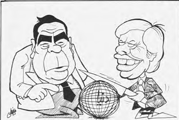
بزرگوار - درست نصفش کن جیمی جون کارتر - اختیارداری برژی چون ماکه با تو این حرفارو نداریم!

در مقدمه طرح آمده است طب ملی در حقیقت شکل تکامل یافته و مترقی تر بیمه پزشکی همگانی است که دولت هزینه های آنرا تامین میکند و کلیه امکاناتی را که برای عرضه خدمات فراهم میآورد بدون تبعیض در اختیار تمام مردم میگردد و از آنجا که خود مستقیماً مسئولیت عرضه خدمات را بعهده میگیرد برنامه ها را با توجه به اولویتهای محلی و منطقه ای و نیاز گروه های مختلف مردم تنظیم مینماید که در نتیجه طب ملی با هدفهای انقلاب اسلامی ایران که برقراری عدالت اجتماعی و برابری مردم در استفاده از خدمات است بیشتر سازگار است