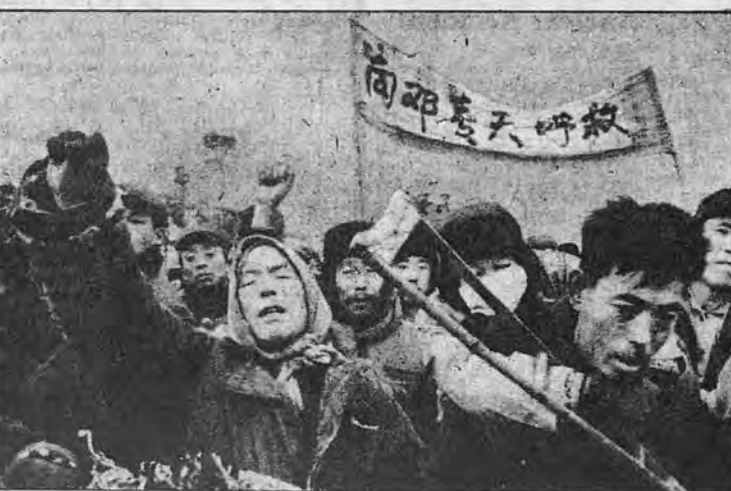
در میدان تینانمن پکن، گروهی از چینی‌ها از معاون نخست وزیر، دنگ سباپینگ خواستار دموکراسی و برسمیت شناختن حقوق بشر هستند.

سلطه سیاسی این حزب نمودند. ممکن است از افراد ارشدی که از زندان "کن جنگ" بیرون آمده‌اند سؤال شود: "هنگامیکه شما، زندانیان را بدلیل اظهار آزادانه عقاید سیاسی خود سرکوب میکردید آیا حقوق خود را تأمین و بدست می‌آوردید؟ پرداخت پول غذا: زندانیان در زندانهای انفرادی بعرض ۳ پو طول ۹ یا نگاهداری میشوند. اگرچه چین یک اجتماع بی طبقاتی آشکار است معذالک زندانیان در ۴ گروه طبق مبلغی که باید برای وعده غذای خود بپردازند (۵/۱۶/۲۶ دلار در ماه) تقسیم میشوند. این رقم بر مبنای حقوق مقرر آنها در مدت اقامت خود در زندان می‌باشد. ولی زندانیان بنسبت سهمیه کامل غذای خود را دریافت میدارند. این موضوع بدلیل فساد و ستگرگی محافظان است که همه زیر ۲۰ سال دارند و سکرتهای تعویض میشوند. مقداری