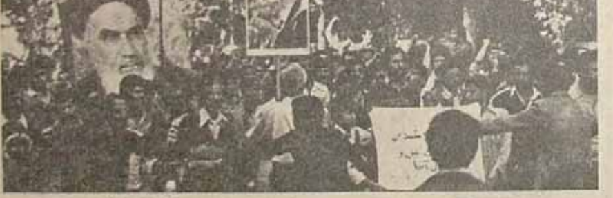
نظارات ضد امپریالیستی در مقابل سفارت امریکا در تهران تبریز شدید خود نسبت به جایگزین، پیمان خود را با امپریالیسم آمریکا و اسرائیل رهبر انقلاب اسلامی ایران