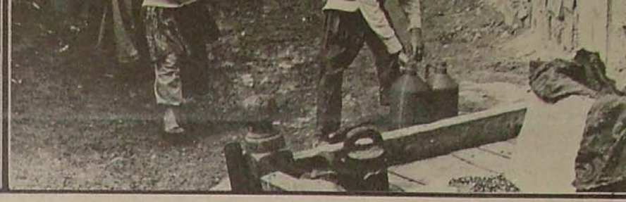
۴ - خطر گسترش زاغه‌ها و ایجاد آلودگی‌های جدید که بر ابعاد مسئله و مشکلات افزوده و حتی طریق منطقی حل مسئله را مشکل می‌سازد.