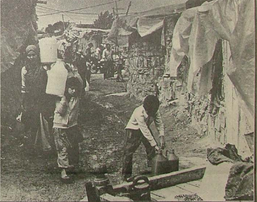
۴ - خطر گسترش زاغه‌ها و ایجاد آلودگی‌های جدید که بر ابعاد مسئله و مشکلات افزوده و حتی طریق منطقی حل مسئله را مشکل می‌سازد.