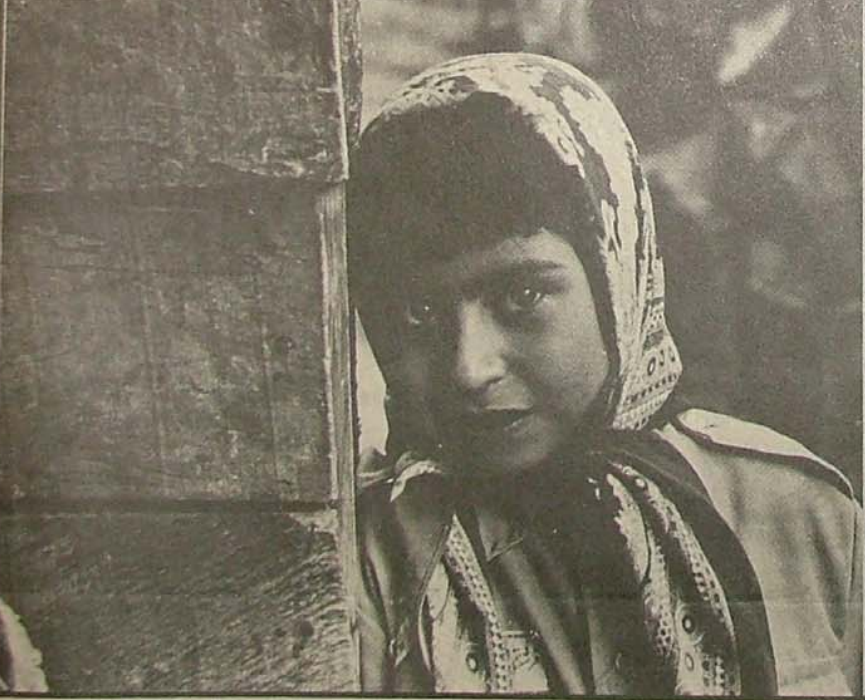
ولی متأسفانه بدلیل کثرت کارهای حیاتی کوتاه مدت اکثر نیروی این سازمان...