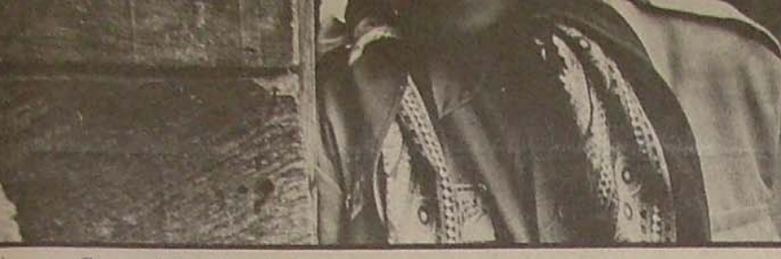
ولی متأسفانه بدلیل کثرت کارهای حیاتی کوتاه مدت اکثر نیروی این سازمان...