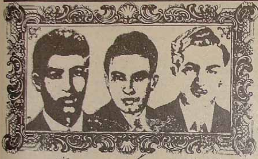
شریعت رزمی بزرگ نیا فیزی