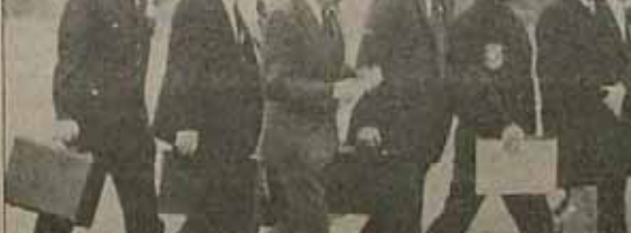
کارتر و مشاوران: امثال کارتر و مشاوران