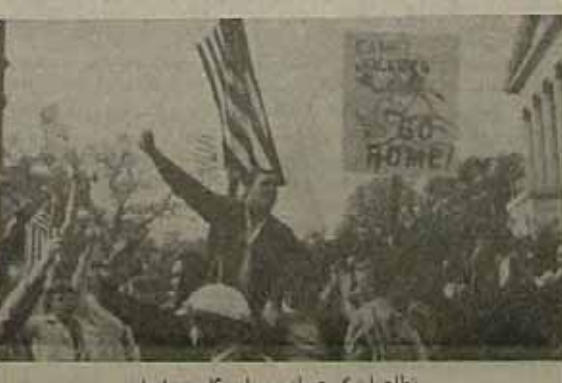
نظرات گروهی از مردم آمریکا بر ضد ایران

ناقصه اکوئوس - نیویورک - شایع شدی که دولت کارتر میگوید با سرکوشی یک راه ساده هم بر سرشاهان داخلی نفاق آید و هم اقدامی نکند که بحران بطنی از کنترل خارج شود. در هفته گذشته صدای شایع شدی هم بالاخره در آمد و ما چند اظهار نظر و بیانات مردم آمریکا زده شد.