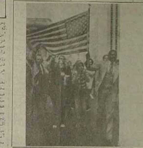
نظرات گروهی از مردم آمریکا بر ضد ایران

مشاهده میبندد این جنایات هنوز از انحصار مطبوعات رسمی و غیررسمی و بیطرفی حمایت از دیننامه "کاروان ملل فرانس بزمه است. " ملت این قدم تا سبیل روزنامه نیویورک تا سبیل چاپ آمریکا میبندد: " ملت این قدم تا سبیل هم میبندد آمریکا بزمه کشورهای اروپای غربی به اقدام عملی علیه ایران. وابستگی شدید این کشورها به نفت ایران و خاورمیانه است. هیچ یک از این کشورها نمیخواهد با نزدیک شدن به آمریکا خود را در جبهه تحریم غنی بکشد.