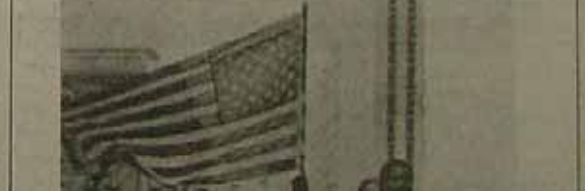
نظرات گروهی از مردم آمریکا بر ضد ایران

پس از اظهارات گندی حمله زبانی به وی شد. حتی رهبران حزب دمکرات که گندی را نامزد ریاست جمهوری کرده است، همصدا با جمهوریخواهان این عمل وی را "اشتباه خطرناک" توصیف کرده اند و اظهار داشتند که در شرایط کنونی باید وحدتکلمه را حفظ کرد. در کنفرانس دیگری وقتی خبرنگاران در مورد پیشنهاد رونالد ریگان مبنی بر اعطای پناهندگی دائمی به شاه نظر گندی را سوال کردند، گندی بار دیگر به فساد و اختناق رژیم شاه حمله کرد و سیاست خارجی آمریکا را در رابطه با رژیم پهلوی تنگناگین برورد انتقاد و سرزنش فرمود.