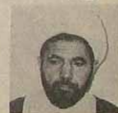
در صفحه ۱۲

جلسه مشترک اعضای شورای انقلاب و وزیر که در پیش تشکیل شد حسن حبیبی سخنگوی شورای انقلاب اظهار داشت: گزارشی توسط وزیر به شورای انقلاب داده شد که مهمترین آنها گزارشی بود که رضا صدر وزیر بازرگانی به شورا ارائه کرد.