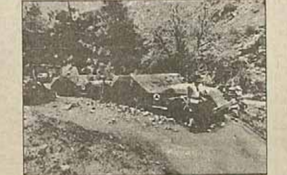
عکس، صحنای بعد از موفقیت مسلمانان مبارز افغانستان را نشان می دهد

عکس، صحنای بعد از موفقیت مسلمانان مبارز افغانستان را نشان می دهد مبارزان مسلمان افغانستان یک هلیکوپتر و ۲۰۰ تانک روسی را منهدم کردند