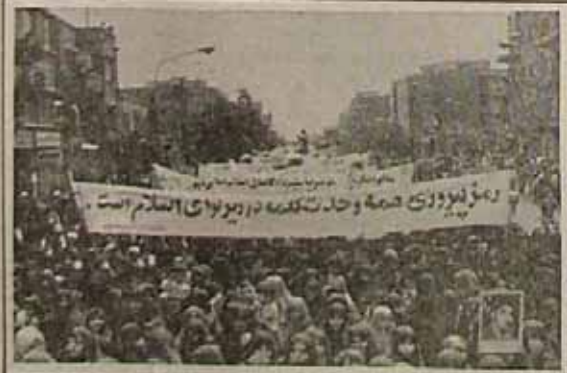
قرآن در زن همان نور و روشنائی را می‌بندد که چشم به افقهای تازه باز میکند

حایفه‌ای بود که از رزم شاه سابق برای ما باقی مانده دارای این نفس عظیم است که ۳ میلیون از این جوانان، از این دختران و پسران و بیشتر پسران به مواد مخدر مثلا هستند. برای کشور ما مبارزه برای نجات اینگونه یکی از عاجل‌ترین و اساسی‌ترین کارهاست. برای علاج اینها تنها از طریق دوا و دما، بر سر راه اقدام کرد. باید برای اینها اسباب آرامش فراهم کرد.