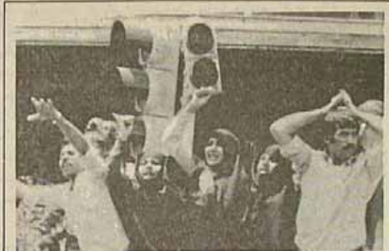
قرآن در زن همان نور و روشنائی را می‌بندد که چشم به افقهای تازه باز میکند

از نظر اندیشه خلق هنرمند یک چیز ممکن است. سایرین را می‌باید اثر هنری که حایفه‌های بشری می‌سازد، حایفه‌های انسانی می‌سازد. معارف، انقلاب است. برای اینکه انقلاب مانعکی است که حایفه انرا ممکن می‌سازد، با از بین بردن عوامل بسیاری. ما ایجاد عوامل نویی، یک جریان را به جریان دیگری تبدیل می‌کند. این هنر را اگر شما بخواهید دلیل از انجام شنیدید مطالعه کنید، حلی کاهل علم ناسی، می‌بوانی انگاش را پیش