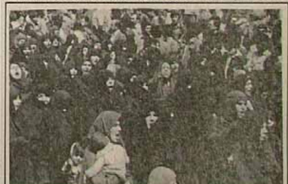
زن در صحنه‌های تعیین کننده حیات بشری

آنها گذراندن بدیده‌ها یک مرحله، یک واقعیتی به واقعیت دیگر است. انسان هم مثل هر بدیده دیگری در تحول از یک واقعیتی که هست، به یک واقعیتی که خواهد شد، می‌ماند. مثلا جامعه ما در تحول از رزم شاه سابق به رزم حاضر، یک واقعیتی بوده