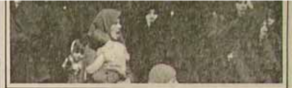
قرآن در زن همان نور و روشنائی را می‌بندد که چشم به افقهای تازه باز میکند

در قرآن ما همه این انقلابهایی که ذکر شده‌است و مورد بحث قرار گرفته، به هم رسیده که من برای شما توضیح دادم، خلق انقلاب را، خلق اثر جدید را در حایفه‌های بشری بکنار هم رسانده نشی کرده و در همه این اثرهای بشری که تاریخ بشری را می‌سازد و مداوم پیوستگی ایجاد می‌کند، بین سلسله‌هایی که خلق‌هایی است، دوره‌های مختلف این تاریخ را تشکیل می‌دهند و این را تصور رشم بیوسماری دور می‌آوریم. در همه این سلسله‌ها به یک رزم در این سده‌های گذشته، و وقتی برای خلق این سلسله‌ها می‌رسند که در این سده‌های پیش‌گفته حایفه‌های بشری خود که به هم رسیده‌اند، بناداری هنر، این انقلابهاست. در سوره روم آیه ۲۱ قرآن می‌گوید که از ساداتهای خدا یکی این است که در نفس حایفه‌های بشری است. حسیاتی آفرید برای اینکه شما آراست می‌دهد ما شما درباره آراست پیدا کنید و من شما بودم و در سنی عشق و وفا و رحمت فراوان داد برای اینکه اینها ساداتهایی باشند. در سنی عشقی باشد برای آنها که می‌اندیشند. من روی سنا گفتم می‌بایست و آبها را برای شما توضیح می‌دهم یکی آراست پیدا کردن، یکی گفتم، یکی گفتم. اینها را برای شما توضیح می‌دهم یکی در این آیه می‌گوید برای اینکه این ساداتهایی باشند. عینی باشد برای کسانی مثلا سعادت می‌کند یا برای کسانی که تجارت می‌کنند برای کسانی که مطلق هستند، می‌گویند برای کسانی که می‌اندیشند و من حایفه