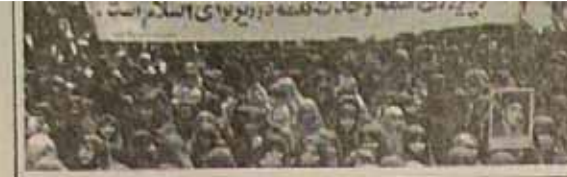
قرآن در زن همان نور و روشنائی را می‌بندد که چشم به افقهای تازه باز میکند

آنها گذراندن بدیده‌ها یک مرحله، یک واقعیتی به واقعیت دیگر است. انسان هم مثل هر بدیده دیگری در تحول از یک واقعیتی که هست، به یک واقعیتی که خواهد شد، می‌ماند. مثلا جامعه ما در تحول از رزم شاه سابق به رزم حاضر، یک واقعیتی بوده