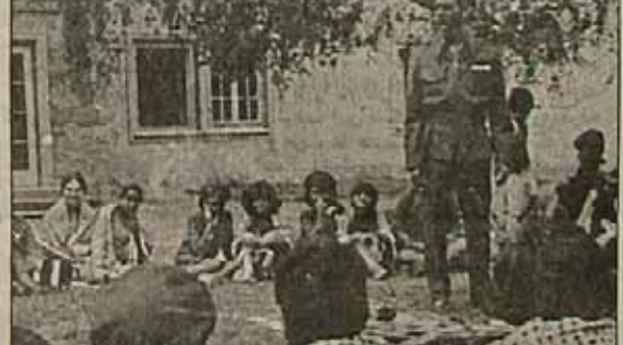
اردوگاه دوستی نوجوانان فلسطینی در سوریه

آغاز فعالیت این اتحادیه سال ۱۹۶۵ یعنی سال بحرکت ذرا آمدن انقلاب فلسطین باز می‌گردد. علت ایجاد چنین مؤسسه‌ای، بخاطر این است که مبارزه علیه دشمن صهیونیست فقط می‌تواند شکل جنگی دراز مدت که در آن چند نسل فلسطینی شرکت خواهند نمود بخود بگیرد. اولیوس اردوگاه تعلیماتی این مؤسسه در ۱۹۶۸ در منطقه کرانه در دره اردن بوجود آمد. در همین حال بود گذر ماه مارس همان سال نخستین نبرد شدید میان نیروهای انقلاب فلسطین و دست‌های صهیونیست رخ داد. نبرد که موجب درهم فروریختن اسطوره شکست ناپذیری اسرائیل گشت. در اولین اردوگاه ۳۰۰ شهرویه (اشمل) شرکت کردند. پس از مدتی اردوگاه‌های دیگری در سوریه و یوزبه در لبنان بوجود آمد. در این اردوگاه‌ها همه جوانان فلسطینی می‌توانند بدون هیچ مانع شوند. این اتحادیه هر ساله در سوریه مدت ۳ ماه، یک اردوگاه تعلیمات نظامی و سیاسی تشکیل می‌دهد و حدود ۱۵۰۰ فلسطینی که در خارج از سرزمین خود زندگی میکنند در آنجا مجتمع می‌شوند. هم‌اکنون که قبلاً ذکر شد از دیگر فعالیت‌های سازمان آزادی‌بخش فلسطین میتوان سیمای فلسطین و اتحادیه ناپیایان فلسطینی را نیز نام برد. فلسطین قلب و مرکز ستیزها و درگیری‌های خاورمیانه است. بدون یک راه‌حل صحیح منطقه فلسطین، صلحی در این منطقه ایجاد نخواهد شد. هویت سیاسی فلسطین در رابطه با تمام مقاومت سازمان فلسطین و در مقابل اشغال و استعمار صهیونیست‌ها معنی پیدا خواهد کرد.