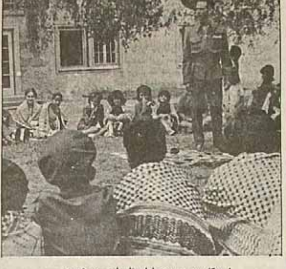
اردوگاه دوستی نوجوانان فلسطینی در سوریه

بهرت - یونایتد پرس - روزنامه لبنانی الشرق امروز نوشت در ستر شهرهای عربستان سعودی یک حالت تشنج وجود دارد و مقادیر هنگفتی پول مرتبا - به بانکهای خارجی فرستاده میشود. الشرق از قول منابع دیپلماتیک عرب نوشت نقایب عربستان از آن بیم دارند که یک موج دیگر ناآرامی و خشونت در کشور بوجود آید زیرا گزارش‌های نیروهای امنیتی عربستان نشان مدهد اینکه ناآرامی هنوز وارد کشور میشود و نیروهای امنیتی نیز قادر به جلوگیری نیستند. در نتیجه تهاجمات و مقامات باید به عربستان بولهای خود را از کشور خارج کرده و در بانکهای خارجی مخصوص بانکهای سوئیس ذخیره میکنند. پس از ماجرای حمله به مسجد الحرام یک در ۲۵ تاسیر گذشته این جریان شدت بیشتری یافته است. به نوشته الشرق نیروهای امنیتی عربستان به