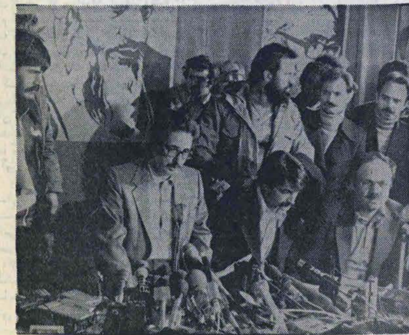
امیدوارم روسیه هر چه زودتر افغانستان را تخلیه کند

امام با بیماران بیمارستان ملاقات کردند صدای جمهوری اسلامی ایران در برنامه اخبار ساعت ۸ دیشب خود اعلام کرد براساس آخرین گزارش رسیده حال رهبر انقلاب اسلامی ایران امام خمینی رضایت بخش است بطوری که امام امت پس از چند روز بستری بودن توانسته امشب برای مدتی از محل مراقبت ویژه خارج شده و با سایر بیماران و کارکنان بیمارستان در داخل بخش دیدار داشته باشند. از سوی دیگر شب گذشته پزشکان معالج امام خمینی اعلام کردند که