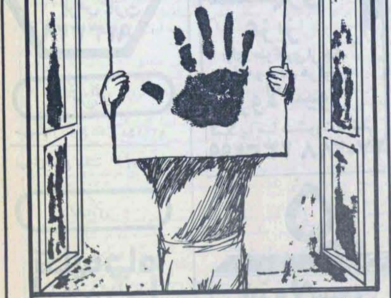
مکان خیابان حافظ نیش سمیه (ثریا سابق) تلفن ۸۲۰۶۵۷ ساعات بازدید ۱۰ صبح الی ۶ بعد از ظهر

چون در تاریخ ۵۸/۵/۲۹ حیدر (که احتمالاً در محل دیگری بقتل رسیده) در آنجا کرب فریب شد و بکفر از آنها بعد از این مراسم فصلبران فرزند ششاسنی و مقول دیگر با شصت و شش زود حدود ۲۵ الی ۲۸ ساله موی سرشکی و کلاه و کلاه اندام با زیر شلوار آبی و پیراهن سایه هیکل متوسط نسبی کلاه و کلاه اندام با زیر شلوار آبی و پیراهن زیمه گلدار آبی چهارخانه و کفشیند با پاشنه بلند برنگ قهوه‌ای تا کنون مورد شناسایی قرار نگرفته‌اند. اینها در دستور فرماید برابر مقررات مراتب با شخصیات کامل و در روزنامه‌های کثیرالانتشار درج نام آنها آشخاصی از هويت جسد و موضوع قتل اطلاعاتی داشته باشد سربعا در اختیار این بازرسی قرار دهند.