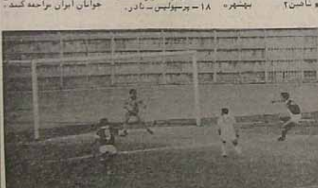
صحنای از دیدار بین تیمهای باقر و برق که با نتیجه ۱-۱ به پایان رسید

دعوت از فوتبال استیای جوان در عصر یکشنبه دیباچه مسابقات فوتبال رده بندی فوتبال در زمینهای ورزشگاههای تهران این دیدارها انجام خواهد گرفت. یکشنبه ۵۹/۱/۳۱ ورزشگاه تختی، ساعت ۱۴ - پوند دو روز یکشنبه ۳ سابقه در ورزشگاه احمدیه انجام گرفت که در پایان این مسابقات بدست آمد. ۲۴ فروردین - ساعت ۱۶ - استادبوم آزادی، ساعت ۱۶ - ساعت ۱۸ - شیرازی - پوند ۲۵ فروردین - ساعت ۱۶ - ساعت ۱۸ - شیرازی - پوند ۲۶ فروردین - ساعت ۱۶ - ساعت ۱۸ - شیرازی - پوند ۲۷ فروردین - ساعت ۱۶ - ساعت ۱۸ - شیرازی - پوند ۲۸ فروردین - ساعت ۱۶ - ساعت ۱۸ - شیرازی - پوند