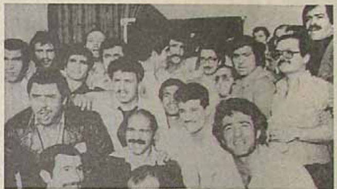
وزیرکاران اتحاد المپیک در حضور رئیس جمهور

در هفته ای که گذشت دکتر ابوالحسن بنی صدر رئیس هیئت مدیره ورزشی انقلاب (تأسیسات سابق) حضور پیدا کرد تا با مسئولین سازمان ورزش و ورزشکاران سخن بگوید. در این دیدار تنی چند از اعضای دولت و شورای انقلاب نیز حضور داشتند. ابتدا حسن شاه حسینی سرپرست سازمان تربیت بدنی سخن گفتند. ایشان در بیان کارنامه المپیک و ورزشی که در این کشور در زمینه ورزشی انجام شده است، به تفصیل پرداختند. رئیس سازمان تربیت بدنی دکتر بنی صدر نیز در این دیدار شرکت کردند که گفت: «من نمی توانم بگویم که ورزشی که در این کشور انجام شده است، در حدی که بتواند ما را برای المپیک آماده کند.» ورزشیای ما بنیان تو حیدری دارد حال آنچه که ما داریم حسن مصوبت ما است که اگر ما تربیتات هم همراه بشود دیگر هیچوقت نشاءالله پشت کنش کبر سلمان را نمیتواند بر زمین ببرد. ورزشیای ما بنیان تو حیدری دارد حسن مصوبت ما است که اگر ما تربیتات هم همراه بشود دیگر هیچوقت نشاءالله پشت کنش کبر سلمان را نمیتواند بر زمین ببرد.