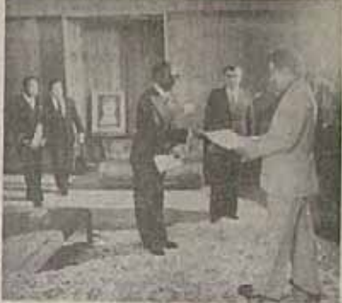
سفر گابن در دیدار با رئیس جمهور