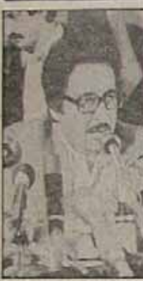
معمار شهر دیروز دکتر ابوالحسن بنی صدر رئیس جمهور در رابطه با برپا شدن توطئه حمله نظامی آمریکا به ایران در یک مصاحبه مطبوعاتی و رادیویی در تهران

درخواست بنی صدر از کشورهای غیرمتعهد برای تشکیل اجلاس فوق العاده