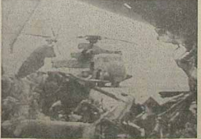
در عکس لاشه منهدم شده هواپیمای نظامی دور پرواز شیطان بزرگ، آمریکا را می بینید. هلی کوپتر و اماندستان نیز در عکس مشهود است.