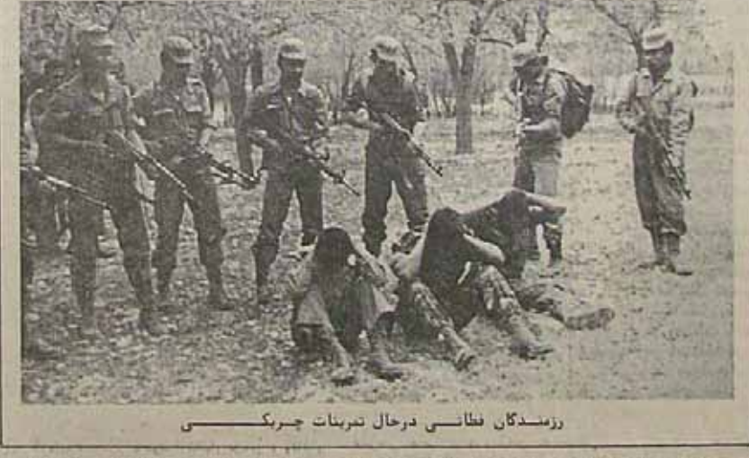
روزمندگان فطانی درحال تعزیرات چیرگی

این تغییر هیئت حاکنه فطانی نیز تا کثیر از اصلاح بود و مردم فطانی باردیگر دست به اعتراض زدند و خواسته‌های خود را طی مواد زیر به دولت تایلند ارائه کردند: - کزیش یک فرد واحد با اختیارات نام جهت اداره امور چهار استان فطانی، نارائوات، جالا و اسول. فرد مزبور از اختیار کامل جهت عزل و نصب کلیه مأموران