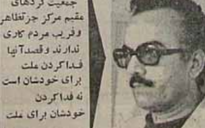
چرا در تهران بنام جمعیتهای کردهای قدیم مرکز جمعیتی وجود دارد که حقیقت سخنگو و ما رهبران آقای مارم الدین صادق وزیر است بنظر شما عملکرد این گروه چگونه است؟

روی اسباب را سیدند تا مسلم - چه ایشان باید احساس میکردند که موجودیتی پیدا کرده اند حقوق مشروع و اسلامی خودشان رسد مانند هم حافظ تمام ملت ایران که جعفر در طول تاریخ گذشته دادمانند از جمله در همین دوران اخیر دهها هزار نفر شهید شدند تا ملتی از جنگل ایمن حکومتها مردم آزاد نشوند بنظر این انقلابی که رنگش بودی از اسلام داشت تلاش میکردیم که گوشه از سلطنت در دست گروههای انقلاب نماند البته در بین گروهها هستند کسانی که قصد خیانت به ملت و با سلطنت ندارند اما متفکرند که راه دیگر برای برودن تا وقتی که اینها سنی ندارند روی عقیده کار میکنند عقیده ها تا وقتی که اینها سنی ولی متافقه عده اینها بسیار کمتر و اکثریت ما فرصت - سلطان با حتی مردوران رژیم سابق و عوامل ساواک است که در این گروهها نفوذ پیدا کرده اند و احتمالاً این گروهها را میجو خاندن ولی واقفیت اینهاست که فکر آن نظامی که مورد نظر آنهاست اگر بپایه بشود بیعت ملت خواهد بود ما روی تجربه و روی آشنایی که ما ذات آن مکتب داریم چنین درک میکنیم که این نظام مارکسیسم خطرناکترین دشمن برای سیرت است چون از همه نظامهای حاکم در دنیا بیشتر از استعداد و دیکتاتوری طرفداری میکند و در هر جا استعداد و دیکتاتوری به هر عنوانی ما هر نوعی استبداد و دیکتاتوری در بین مردم خواهد بود - حتی اگر نظامها هم وجود داشته باشند آن نظام برای سیرت سبیل به زهرمار میشود چون ارزش انسان به آزادی فکر و زبان و بیان است و در دیکتاتوری معولا آزادی زبان و بیان و قلم محدود و ممنوع است در نتیجه وجود تمام این گروهها با درکی که ما داریم برای مردم در کردستان و در سایر استان افت میباشد - همین دلیل گوئیدیم ناخانی که ایشان داریم یکدگریم این مردم زیر بار دیکتاتوری سزارهای