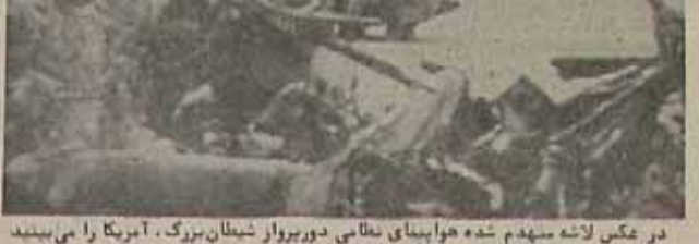
در عکس لاشه منهدم شده هواپیمای نظامی دور پرواز شیطان بزرگ، آمریکا را می بینید.