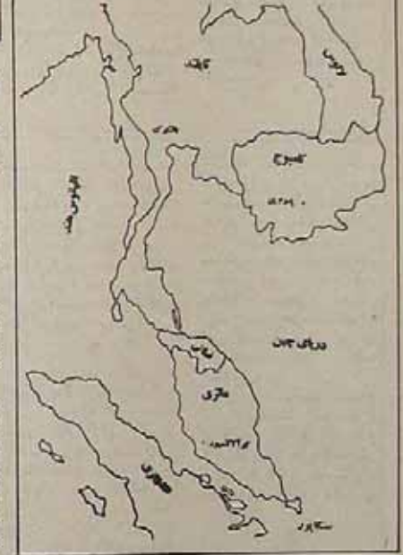
تا ۸۵۰۰۰ نفر است. در نخستین جنگ بیش از ۴۰۰۰ نفر از مردم فطالی دستگیر شده به بانکوک انتقال یافتند. اخلاف آنان آنگ بصورت یک‌قلیت مالایایی در بخش‌های مرکزی تایلند زندگی میکنند.

نخستین جنگ بیش از ۴۰۰۰ نفر از مردم فطالی دستگیر شده به بانکوک انتقال یافتند. اخلاف آنان آنگ بصورت یک‌قلیت مالایایی در بخش‌های مرکزی تایلند زندگی میکنند. بوقعیت جغرافیایی و منابع اقتصادی فطالی از شمال به خليج سام، از شرق به درسی چین، از جنوب به مالزی و از غرب به اقیانوس هند محدود میشود. وسعت فطالی ۱۶ هزار مایل مربع و جمعیت آن در حدود ۴ میلیون نفر است. مردم فطالی با مردم مالایا و اندونزی هم‌نژادند. زبان فطالی همان زبان مالایایی است که به خط عربی و لاتین نوشته میشود. کش و تولید کالوجو از صنایع مهم فطالی است که دومین قلم صادراتی تایلند را تشکیل میدهد. از صادرات مهم فطالی قلع، سرب و چوب را میتوان نام سرد. در ناحیه نارائوات طلا نیز یافت میشود. دیگر منابع اقتصادی فطالی عبارتند از ماهی، نارگیل، تنکس، نقره، آهن، مس، آبنسوان و منگنز. برنج و سیرجات بوفور در فطالی کنت میشود. فطالی ۳۵ درصد از درآمد ارزی تایلند را