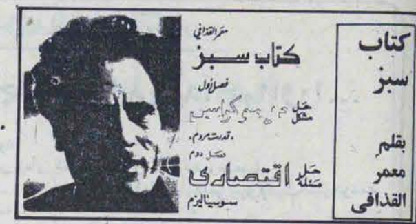
کتاب سبز بمقام معمرب القادی

فقدار شوروی بود، انبوی از ن جهت آمریکا برای نزدیکی در منطقه دهانه جنوبی دریای رادراختیار گرفت تا تأثیر سیاست بر سر راه سیاست کشورش باقی وی آورد و در آن طرف باب- کر هم جنبه گیری کردند. و آن بین جنبونی، همان از ناحیه دید قرار گرفت و از سوی دیگر ن چرک علیه عدن وارد معرکه در باب استبداد جنگ قدرتها هر کدام در مقطع های زمانی گرفتند. غرب بین شمالی، و شرقی، انبوی و چین گهگاه برمیخیزد بکار میگیرند. با تلاشهای پیگیر سعی در نموده ولی بدون اخذ نتیجه بر سر راه سیاست کشورش باقی نیل شنیده شد که از مقام خود صریحا علت استعفاش روشن چندین پیش از کشمکشهای پشت میدادند. علی ناصر محمد که بد و پس از عبدالفتاح اسماعیل کشور رسید دارای وجهه پر- در ارتش است. علی عنتر وزیر بیک علی ناصر محمد می باشد با اسماعیل مخالفت کرد و تمایل از شوروی از بوسلای خریداری نحد در ارگانهای مهم از جمله پس جمهور بکاهند و نامید علن اخبر به اوج رسیده بود بر اثر زبردقاعت جهت تجدیدنظر در و طرز رفتار هیئت حاکمه فعلی در یک کشتی جنگی در خلیج شمر رهبران شوروی را برانگیخته ی عمده بین جناحهای هیئت برغم گرایشهای سیاسی رهبران بدرت با بیدریم که بین آنها انقلاب ما در منطقه است. و انقلاب و چه پس از پیروزی آن خود را از انقلاب اسلامی، اعلام لهار تمایل شده است با رعایت در سطح سفارت با یکدیگر روابط به امید گسترش روابط همدجلانه سی و نزدیکی دو ملت دوست و