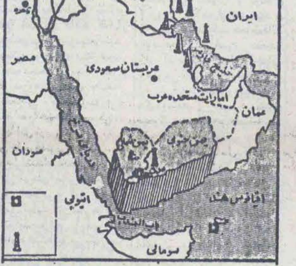
بر روی نقشه موقعیت یمن جنوبی بخوبی مشهود است

۲۶۷۵/م/الف شکرت مخابرات ایران تعداد ۳۰ دستگاه ولتاژ گولاتورا با رعایت شرایط زیر سی. اند. اف بندر خرمشهر یا بندر امام خمینی یا جلفای ایران و با تحویل اتمام شرکت مخابرات ایران در تهران از طریق مناقصه خریداری مینماید.