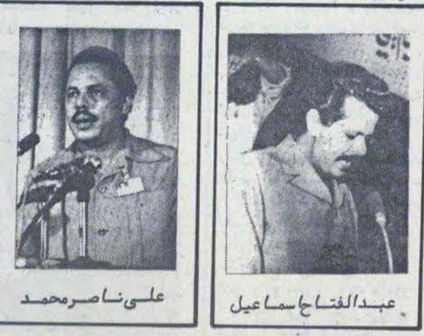
علی ناصر محمد / عبدالفتاح اسماعیل

برای جلب حمایت آن کشور بکار میبرند رهبران یمن- جنوبی نیز در این موضع حرکت کردند، هرچند بین حکام مارکسیست یمن جنوبی اختلاف نظرهای وجودداشت چنانچه سالم ربیع علی که به داشتن گرایش به چین معروف بود برعکس سایر اعضای شورای ریاست جمهوری، خواستار نزدیکی بیشتر با کشورهای عربی میانه‌رو همسایه خود بود، همسایگانی چون یمن شمالی، عمان و خصوصاً عربستان سعودی که در سال ۱۹۷۶ زعمای این کشور وعده کرده بودند اگر یمن جنوبی از دریافت کمکهای شوروی خودداری کند ۴۰۰ میلیون دلار به این کشور کمک بلاعوض بپردازد خواهند کرد. ولی شوروی که طی سالهای اخیر توانسته بود یک نقطه انگاشی استراتژیکی در دریای سرخ مشرف بر اقیانوس هند برای خود دست‌وپا کند برای جبران خسارت ناشی از دست‌دادن بندر بربره در سومالی، به تقویت موضع جزیره "سکوتره" متعلق به یمن جنوبی و بفاصله ۵۰۰ کیلومتری ساحل عدن پرداخته بود با این سیاست سالم ربیع علی موافق نبود.