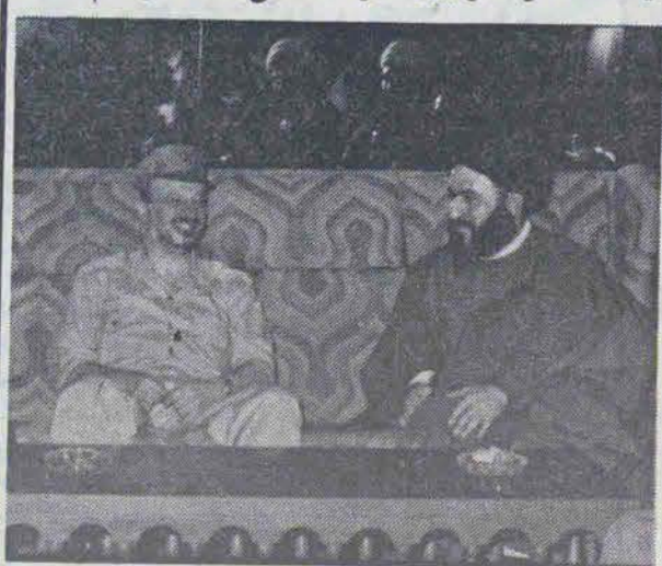
آیت الله سید حسین شیرازی و یاسر عرفات

قم - خبرنگار انقلاب اسلامی - بدینال انتشار خبر شهادت آیت الله سید حسن شیرازی در بیروت خبرنگار ما در قم با یکی از شاگردان ایشان بنام حجت الاسلام خاتمی پیرامون خبر شهادت آیت الله سید حسن شیرازی در بیروت به گفتگو نشست. وی در این مورد اظهار داشت: