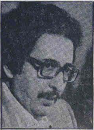
رئیس جمهوری در جمع روحانیت مبارز تهران و نمایندگان مجلس: مردم باید بدست انتخاب انجام دادند، امور باید بدست منتخبان مردم باشد

آیت الله خسر و شاهی: مردم باید ببینند که نمایندگان مثل صدر اسلام با کمال عظمت و رافت با هم بحث می کنند