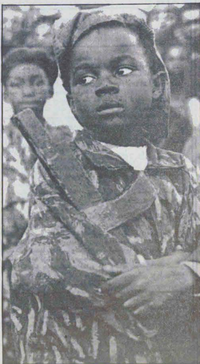
کودکان افریقای جنوبی به امید فردای روشنتر

شرایط زندگی اکثر سیاه پوستان افریقای جنوبی مانند بیشتر کشورهای جهان سوم تا آن درجه اسفناک و حزن‌آور است که مسئله اساسی سد جوع شده است و هر ساله ۲۵۰۰۰ کودک کمتر از ۵ سال بعلت سوء تغذیه جان می‌سپارند.