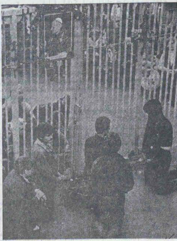
کارگران اعتصابی لهستان در حال اجرای مراسم مذهبی

در حالیکه یکماه از آغاز اعتصابات کارگری لهستان میگذرد هنوز این کشور از بحران خارج نشده و اوضاع به حالت عادی بازنگشته است. اگرچه لهستان از ۱۰ سال گذشته همواره با مشکلات و مسائلی روبرو بوده که بیشتر از سوی کارگران و روشنفکران ایجاد گردیده، با اینحال از آنجائی که اینبار کارگران و روشنفکران ناراضی در سطح گستردهای علیه دولت متحد شدهاند لذا دولت و رهبری کشور خود را در مواجهه با این جنبش در تنگنا می‌یابند. مطلبی که در زیر از نظر خوانندگان میگذرد تاریخچه (۱۰ ساله مبارزات کارگران لهستان است که همواره برای ابراز مخالفت خود دست به اعتصاب زدهاند.