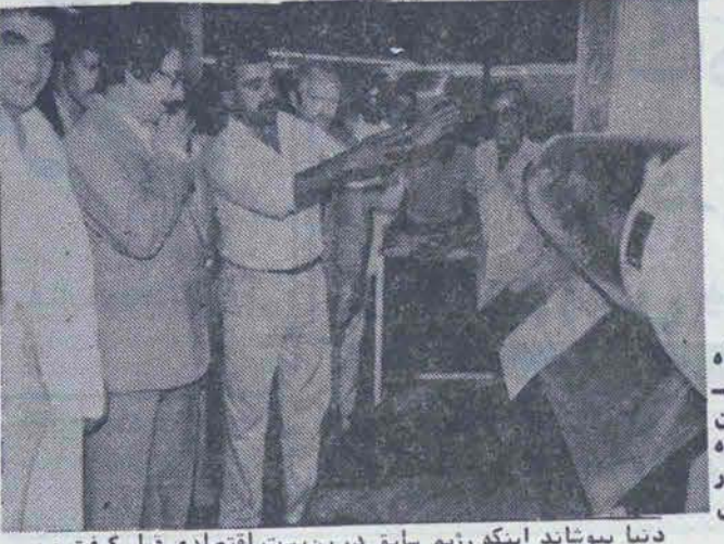
دینا بیوناند اینکه رژیم سابق در بن بست اقتصادی قرار گرفت و بر این بن بستها، بن بستهای دیگر اضافه گشت و در انجام رژیم سقوط کرد و اینک حقایق آن روز در معرض دید مردم ما و مردم جهان است. رئیس جمهور در قسمت دیگری از سخنان خود افزود: