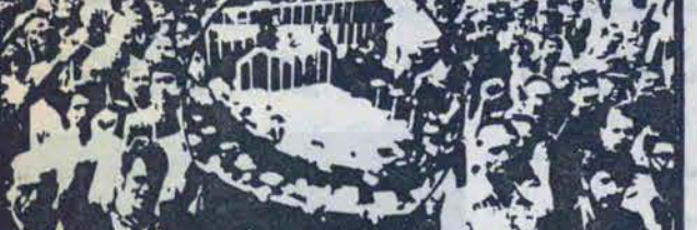
تلفن ۳۱۳۳۲۹ از ساعت ۶ تا ۴ بعد از ظهر