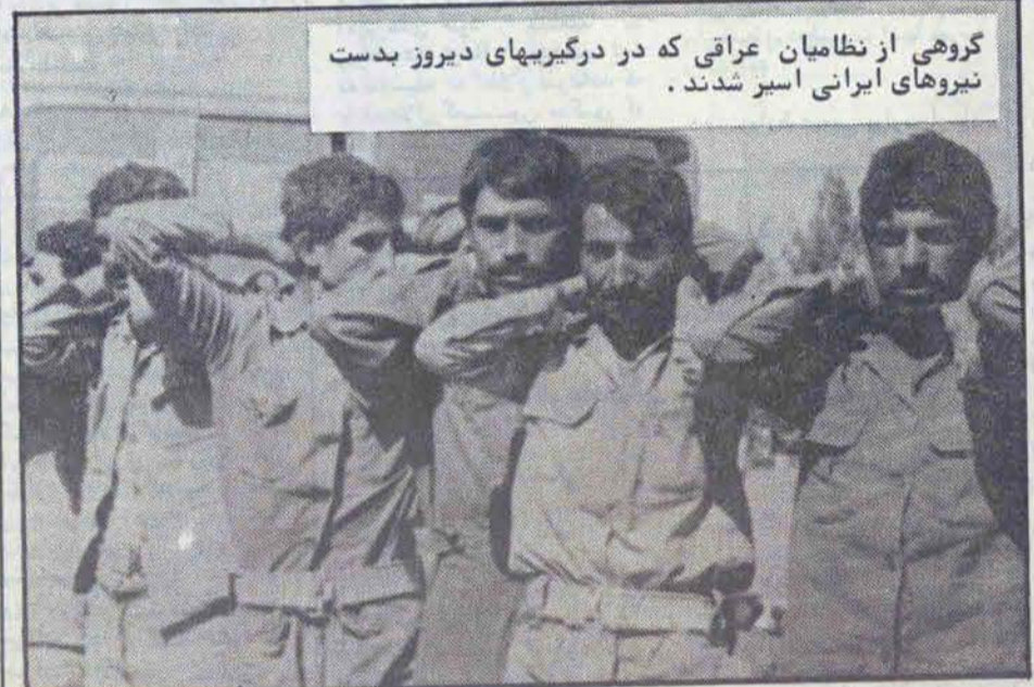
گروهی از نظامیان عراقی که در درگیریهای دیروز بدست نیروهای ایرانی اسیر شدند.

در جبهه های شوش، گرخه، سوسنگرد و اهواز نیروهای ایران پیشروی خود را آغاز کرده اند