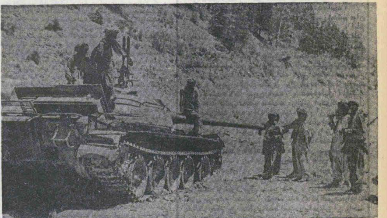
زده‌پوشی که مشاهده میکنید شکار مبارزین مسلمان افغانی است که دشمن برای نابودی آنان به جبهه گسیل داشته ولی اکنون در چنگشان اسیرگشته تا در موعد مقرر بقلب دشمنان شلیک گردد.