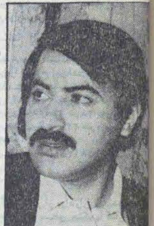
نایب رئیس کل بانک مرکزی ایران، علیرضا نوپوری. در مصاحبه با «انقلاب اسلامی» توضیح داد که حجم پولهای مسدود شده ایران در بانکهای آمریکایی و اروپایی بیش از ۴ میلیارد دلار است.

از آنجا که بررسی مسئله گروگانتها مسئله روز مجلس شورای اسلامی است و طبیعتاً گروگانتگیری صرفاً یک مسئله سیاسی نبود. توافق دیگری نیز از جمله تحریم اقتصادی ایران و همچنین انسداد پولهای ایران را نیز در برداشته است بر آن زمینه تا در زمینه حجم دارائیهای مسدود شده ایران و چگونگی مسدود شدن این پولها و عوارض ناشی از آن با آقای علیرضا نوپوری رئیس کل بانک مرکزی ایران و رئیس کمیته دعوی خارجی ایران مصاحبه ای داشته باشیم که می خوانید: