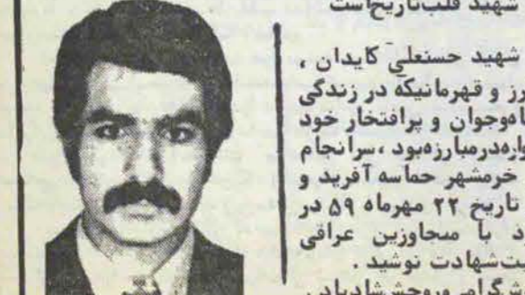
بازگشایی روحش شاد باد.