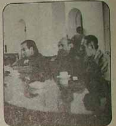
ایمان صادقانه در میان خاک و خون برای برپایی جمهوری اسلامی ایران تلاش میکنند.