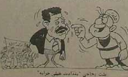
نقد روحانی مقامات خطی خرابه