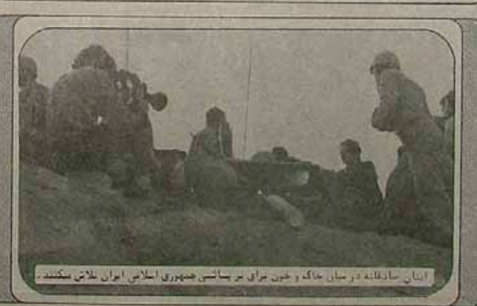
ایمان صادقانه در میان خاک و خون برای برپایی جمهوری اسلامی ایران تلاش میکنند.