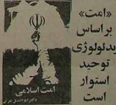
«امت» بر اساس ایدئولوژی توحید استوار است

جناب آقای دکتر باقری وزیر فرهنگ و آموزش عالی ما دانشگاهیان در خرابان انقلاب، بر سرک مردم ایران علیه رژیم وابسته به امپریالیسم و مغزپهلوانی همراه با دیگر عسکران مبارزه کرده و در این مدت علاوه بر طرح خواسته‌های عمومی سراسری در صورت برابری آزادی و معافیت امور دانشگاهیان از وجود استعلاک دانشگاهی و اعطای حقوق دانشگاهیان در تمام امور مربوطه رژیم گذشته باستانی خود را به ما تحویل داده است. ما در این مدت به عنوان یکی از دانشجویان و محققان جامعه در خدمت و معاضدت و همکاری خود با شما و سایر همکاران و دوستان عزیز خود، در جهت آزادی و استقلال دانشگاهی و معافیت امور دانشگاهیان از وجود استعلاک دانشگاهی و اعطای حقوق دانشگاهیان در تمام امور مربوطه رژیم گذشته باستانی خود را به ما تحویل داده است. ما در این مدت به عنوان یکی از دانشجویان و محققان جامعه در خدمت و معاضدت و همکاری خود با شما و سایر همکاران و دوستان عزیز خود، در جهت آزادی و استقلال دانشگاهی و معافیت امور دانشگاهیان از وجود استعلاک دانشگاهی و اعطای حقوق دانشگاهیان در تمام امور مربوطه رژیم گذشته باستانی خود را به ما تحویل داده است.