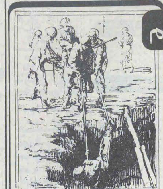
ITTT in Chile and SERVING PEOPLE AND NATIONS EVERYWHERE