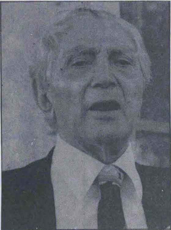
دکتر کریم سنجابی از جبهه ملی ایران

وقتی این خطرات مستمر و مداوم است باید قوانین و بنیادهای اجتماعی و مقررات ملکی و نظام حکومتی را بنا بر این شرایط مورد نظر و عمل قرار بگیرد... از این رو حدود آزادی برای فعالیت احزاب و گروههای سیاسی میبایست باتوجه به هدفهای انقلاب و شرایطی که مسترمان "کشور ما" با آن مواجه است تعیین گردد... هیچگاه نباید بعنوان وضع فوق العاده که در رژیم پهلوی عنوان میشد وسیله تعطیل آزادیها و ایجاد اختناق و بهانه برای توجیه روشهای استبدادی بود، بکار گرفته شود... همسین دلیل است که اصل نهم قانون اساسی ماکتبات است که به هیچ وجه و به هیچ بهانه ای، حتی به بهانه استقلال هم، آزادیهای اساسی ملت ایران را نمیتوان سلب کرد... حال باتوجه به این مسائل باید بگوئیم اصل بیست و ششم قانون