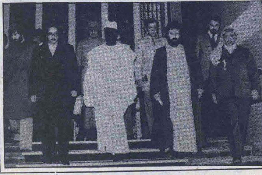
در صفحه آخر

ما بر اه شیطان نخواهیم رفت و چون و چرا اثار سیدن بحق باشما ادامه خواهیم داد طرح پیشنهادی هیئت رسیدگی به جنگ تسلیم شورای عالی دفاع شد