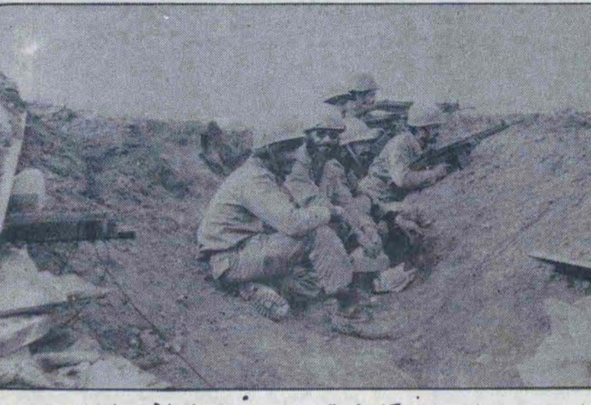
از سوی ستاد مشترک ارتش جمهوری اسلامی ایران: به رعایت اصول خاموشی اکیدا توجه داده شد

طی یک نبرد ۷۲ ساعته توسط رزمندگان ژاندارمری: یکی از ارتفاعات منطقه چغالوند از تصرف دشمن خارج شد در این نبرد نیر وهای عراقی ۳۵۰ کشته بر جای گذاشتند