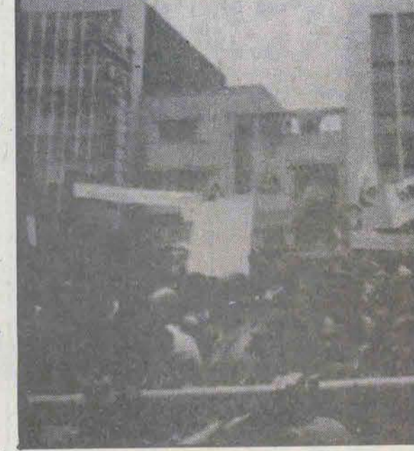
مردم می‌روند تا همراه رئیس جمهور و شورای انقلاب دانشگاه را بشکستند. باین امید که با حضور خود «انقلاب را تقویت کنند»

مجموعه در چارچوب نظام آموزش عالی... (تخلیه در چارچوب نظام آموزش عالی)