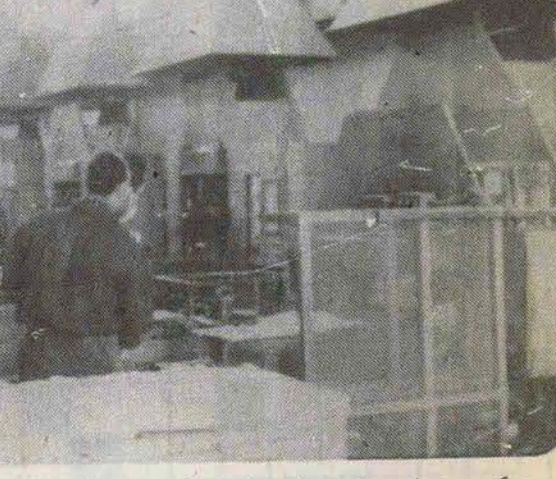
اوست که چرخهای عظیم جامد را حرکت در می آورد.

● متأسفانه کسی به این فکر نیست که کارفرمایان و کارگران را بوسیله کلاسهای آموزشی و تفریحی و تفریحی و تفریحی و تفریحی با مسائل حفاظتی و بهداشتی مجهز کار آشنا کنیم.