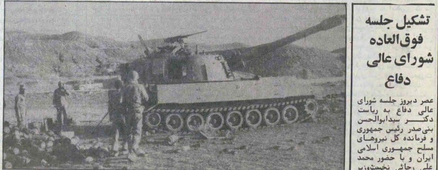
در صفحه ۲

تحت نظر دیروز در محل سالن اجتماعات وزارت دادگستری جلسه معارفه با اعضای هیئت منتهی به امیران نظام برگزار شد