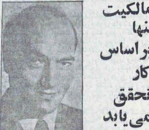
مالکیت بر سرمایه برای استفاده کار معنی ندارد