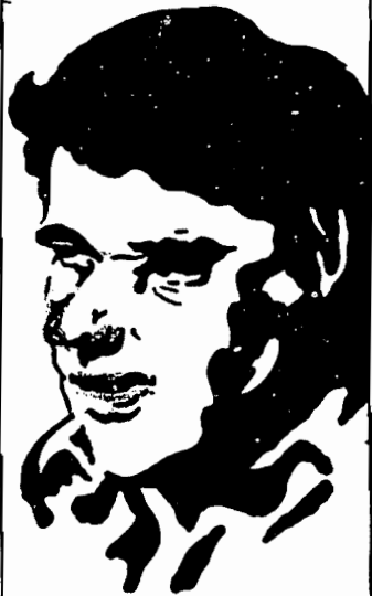
دروود ما بر:

ما تأمین آزادیهای دمکراتیک را برای تمام زنان و مردان ایرانی و برسمیت شناختن آزادیهای فرهنگی و قومی و حقوق ملی همه خلقهای ایران را خواستاریم.