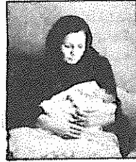
مادر و فرزند خردسال فرزین