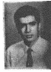
رفیق شهید فدایی خلق فرامرز شریفی