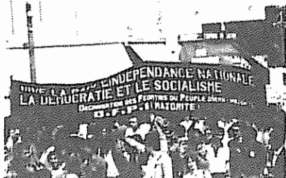
هواداران سازمان در تظاهرات صلح در فرانسه

همین طور اعلامیه مشترکی از طرف هواداران سازمان فدائیان خلق ایران ( اکثریت ) و سازمان جوانان توده ( شاخه آلمان ) به زبان آلمانی توزیع شد که در آن ضمن افشای سیاست جنگ افروزان امپریالیسم جهانی سرکردگی امپریالیسم آمریکا ، توطئه های امپریالیسم در منطقه و کشورمان نیز افشاء شد . این تظاهرات عظیم ترین تظاهرات پس از جنگ جهانی دوم بود .