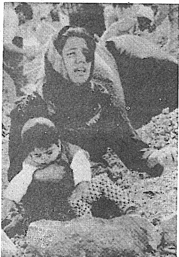
تقطق توانسته است پسرش را نجات دهد. در سوک شوهر و دیگر عزیزانش بر سر می‌کوبد.

۳۱ دقیقه بعد از نیمه شب ۳۱ خرداد ۱۳۶۹ - زلزله‌ای مهیب بخشهای وسیعی از ایران را لرزاند و در دقیقه‌های شهرهای بزرگ و آبادهای کوچک را به تلی از خاک بدل کرد. شدت زلزله بین ۷/۳ تا ۷/۹ ریشتر اعلام شد. تعداد واقعی قربانیان این فاجعه