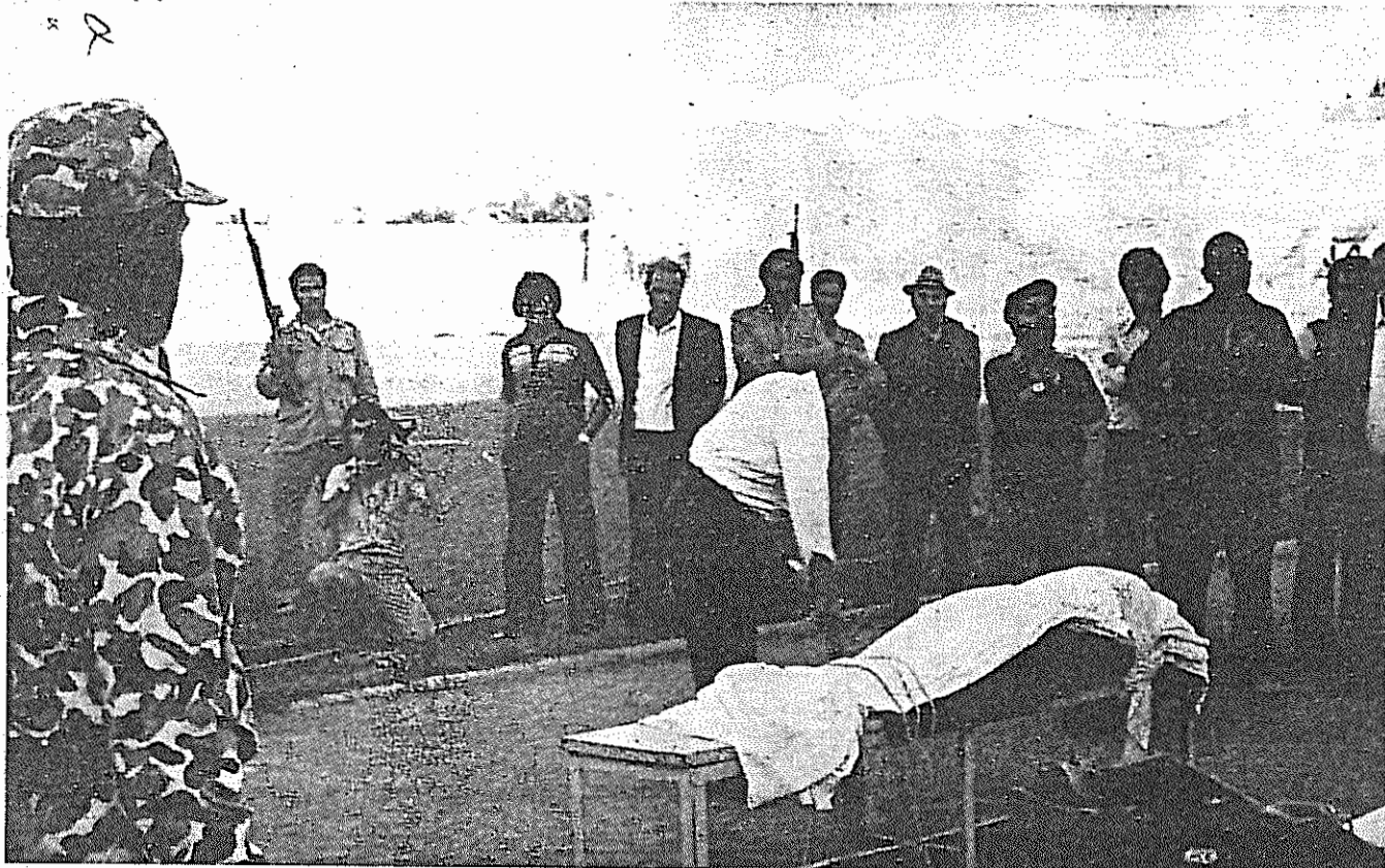
نه کشتار و اعدام‌ها و نه صحنه‌هایی اینچنینی از خاطره‌ها و انظار محو نشده است.

به ۵۳ نفر افزایش یافتند. ۱۰ عضو جدید از کشورهای رشد ناپخته هستند، که از مدت‌ها پیش خواهان افزایش نقش "جهان سوم" در این کمیسیون بوده‌اند. اجلاس سالانه هم چنین به جای ۱۰ عضو که مدت عضویت ۳ ساله آنها در کمیسیون به اتمام رسیده بود، اعضای جدید برگزید. آنکولا، انگلیس، بنگلادش، سریلانکا، سوریه، شیلی، قبرس، کانادا، کلمبیا، کوبا، و هند از جمله اعضای جدید کمیسیون حقوق بشر سازمان ملل متحد هستند. عضویت جمهوری اسلامی در کمیسیون حقوق بشر سازمان ملل متحد در شرایطی صورت می‌گیرد که این رژیم آزادی‌کش و ضد حقوق بشر، به مدت یک - سه است به دلیل نقض وحشیانه و پی در پی حقوق بشر در ایران، از سوی کمیسیون حقوق بشر سازمان ملل متحد محکوم شناخته شده است و هم‌اکنون نیز مسئله حقوق بشر در ایران هم‌چنان در دستور کار این کمیسیون قرار دارد. رژیم جمهوری اسلامی بارها و رسماً اعلام داشته است که بیانیه جهانی حقوق بشر را نمی‌پذیرد و به "حقوق بشر اسلامی" معتقد است و این بیانیه را در تقابل با حقوق بشر اسلامی می‌شناسد. و حال سوال این است: رژیم چینی که یکی از جنایتکارترین کارنامه‌ها را در هر صده رعایت ابتدایی‌ترین حقوق انسانها به نمایش نهاده،