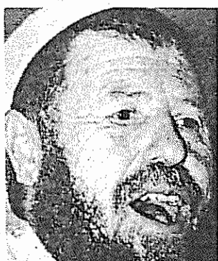
حمینی الجزایر: شیخ عباسی مدنی

با این که عباسی مدنی از پیروزی بنیادگرایان دم می‌زند،