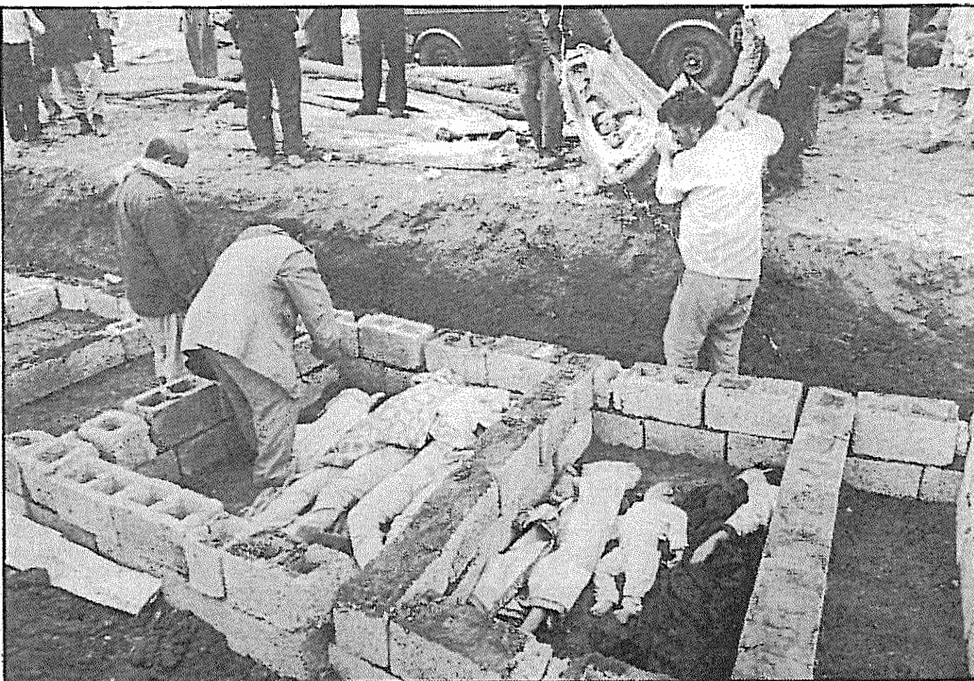
آجر بر آجر می‌گذارد و همه زندگیش را دفن می‌کند اما تاکنون پس از گذشت یکسال برای ایجاد پناهگاه و تسلی در دش میج آجری بر روی آجر گذاشته نشده است.

جناح تندرو می‌کوشد با اتخاذ این تاکتیک‌ها موقعیت تضعیف شده خود را ترمیم نماید، نیروهای خود را حول مطبوعات جدید متمرکز کند، حمایت خامنه‌ای و احمد خمینی را جلب نماید و به ارگان‌های اصلی جناح حاکم حمله برد.