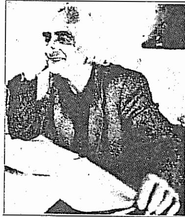
ح - بمخداد

نام تئوپینکوس برای چپ اروپا فراموش نشدنی است. وی به رشم عضویت در حزب کمونیست سوئیس با همه گرایشهای چپ آمیزگاری و پرو و بیادداشت و به سهم خود میکوشید که خدمتگزار همه آنها باشد. این کار برای او همیشه آسان نبود و گاه و بیگاه از همه سو با طعن و لحن های فراوان مواجه میگشت. اما وی امیدوارانه راه خویش را دنبال کرد و تا دم مرگ نیز از پاننشست خدمات برجسته تئوپه جنبش چپ اروپا را بویژه نسل جوان و همیانگر دهه ۷۰ که با تظاهرات و اعتصابات دانشجویی اروپا را به لرزه درآورد، هیچگاه از یاد نخواهد برد. تئو به اعتبار روح سرکش و نوجوش پیوسته با رهبری جموداندیش حزب کمونیست سوئیس بحث و جدل داشت و یکبار هم از حزب بیرون گذاشته شد. با اینهمه وی هیچگاه به طور قطعی از این حزب دل نبرید و با آرزوی متحول ساختن آن تا به آخر در آن باقی ماند. در نظر چپ نو و فیروستی اروپا نوجویی و آزاد اندیشی تئو و عضویت وی در حزب کمونیست نوعی تناقض و دوگانگی به شمار می آمد. اما