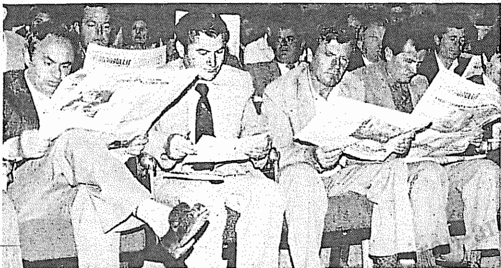
روزنامه‌های آزاد و شوق مطالعه در میان نمایندگان کنگره حزب کمونیست آلبانی

تاریخی برای روسیه و اتحاد شوروی خواند. همزمان با انتخابات ریاست جمهوری روسیه، انتخاباتی نیز بر سر تعیین نام شهر لنینگراد انتخابات توجه به شرکت فقط ۷ درصد از حاضرین رای از ۱۰۵ میلیون نفر به زحمت ۵۰ درصد آرای کل مردم روسیه را در بر میگیرد. جرج بوش رئیس‌جمهور آمریکا موفقیت یلتسین را «خوب و مناسب» برای روسها دانست. کاخ سفید نیز در روز پنجشنبه انتخابات یلتسین را گامی