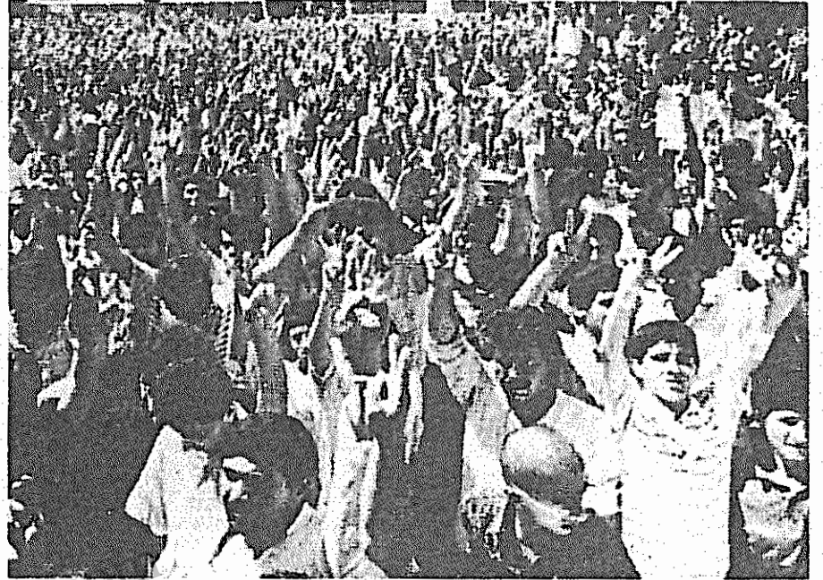
هزاران کرد در دیار بکر در مراسم تشییع جنازه یکی از رهبران جنبش کردستان ترکیه علیه پلیس و دولت ترکیه تظاهرات کردند.

ایدین یکی از قربانیان سیاست ترور و موج خشونت بدایت شده توسط دولت ترکیه است که در شش هفته اخیر در جنوب شرقی ترکیه بیش از ۸۰ قربانی داشته است. درگیری نظامی بین پیشمرگه ها و نیروهای امنیتی ترکیه همچنان ادامه دارد. آخرین درگیری ها در منطقه سیوان بین پیشمرگه های حزب کارگران کردستان و نیروهای امنیتی بوقوع پیوسته است. در اعتراض به سیاست دولت ترکیه هفته گذشته سفارت ترکیه در لندن و دفتر سازمان حقوق بین الملل در بروکسل پایتخت بلژیک توسط گروهی از کردیها اشغال شد.