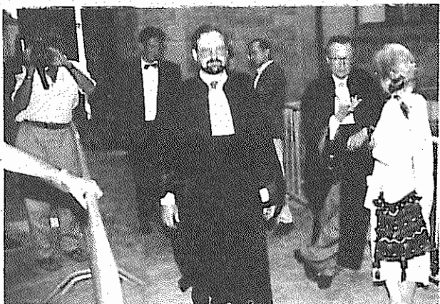
وکلا مدافع جمهوری اسلامی و خبرنگار سوئیس در حال خروج از دادگاه

خمینی کشتار همسر را امضا کرده بود. وقتی کسی از حقوق بشر دفاع می‌کند بهای آن را نیز می‌پردازد." "محاکمه این روزنامه‌نگار به دادگاهی برای محاکمه جمهوری اسلامی تبدیل گردید. شاهدانی که به جایگاه شهود احضار شدند همگی تابت کردند که کاظم رجوی لاینقطع از تهران تهدید می‌شد." "جالب‌ترین نکته این بود که دادستان کل که در واقع میبایست مدافع اتهام باشد به مقابله با جمهوری اسلامی برخاست. او با اشاره به تاریخچه اقدامات تروریستی رژیم جمهوری اسلامی از جمله گروگان‌گیری، صدور حکم اعدام برای سلمان رشدی، کشتار مخالفین از جانب رژیم را منتفی