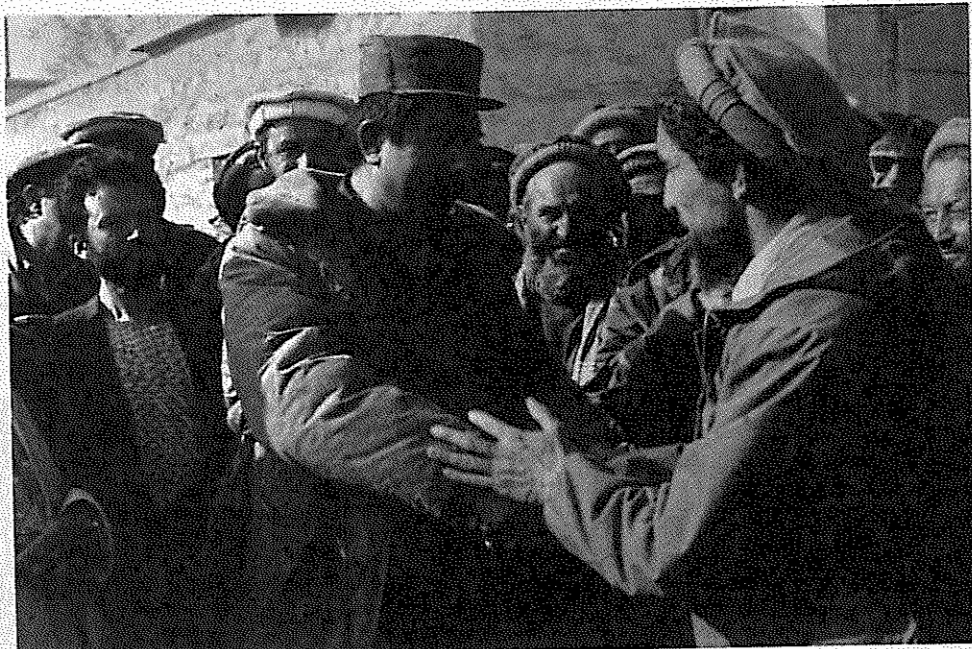
ملاقات دو متحد تازه: احمد شاه مسعود و ژنرال دوستم

کابل پایتخت افغانستان در خرداد ماه شاهد درگیری های سنگین میان نیروی حزب وحدت اسلامی (مورد حمایت تهران) و اتحاد اسلامی (مورد حمایت هریستان) بود. تنها ظرف یک هفته در این درگیری ها حداقل ۱۵۰ نفر کشته و بیش از هزار تن مجروح شدند. دو طرف، هریک از طرف مقابل صدها گروگان گرفتند. برخی گروگان ها در ساختمان های متروکه بطور جمعی اعدام شدند. طرفین درگیر به آمبولانس ها و کامیون های حامل مجروحین رقیب خود حمله کردند. در یک مورد، بیمارستان هلال احمر افغانستان مورد اصابت خمپاره قرار گرفت که منجر به قطع برق بیمارستان شد. مجله آمریکایی تایم به نقل از یک دیپلمات متعین کابل می نویسد که این شهر، یک بیروت بدون "خط سبز" است. ("خط سبز" در طول سال هجرز میان مناطق مسیحی ها و مسلمانان در بیروت بود و نبردهای سنگینی در امتداد آن صورت گرفت. گنایه بیروت بدون خط سبز، به معنای این است که گروه های مسلح در کابل مناطق تعریف شده ای ندارند و سراسر شهر مرصه نبردهای آنهاست.) درگیری میان نیروهای شیعه وهابی، نبرد جدیدی علاوه بر جنگی است که از هنگام سقوط کابل هرازگاه میان شبه نظامیان ازبک عبدالرشید دوستم و نیروهای حزب اسلامی گلبدین حکمت یار بالا میگیرد. رقابت