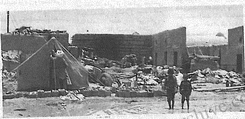
گردید تازه به مراحل پایانی ساخت رسیده است. در صورت اتمام این خانه‌ها ۲۰۰۰ سیل زده می‌توانند از چادرنشینی رهایی یابند. اما ۹۰۰۰ تن دیگر باید باز هم منتظر بمانند.

مردم سیستان در چهارسال اخیر سه بار قربانی سیل ناشی از طغیان میرمند گردیدند: فروردین ۶۸، بهمن ۶۹ و فروردین ۷۰. این سیلها علاوه بر خسارات جانی ۲۴۰ روستا را در هم کوبید و ۱۱ هزار واحد مسکونی را ویران کرد. سیل زدگان بی‌خانمان در همه