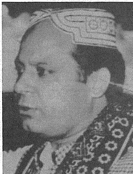
آی‌بی نظیر بوتو خواهد توانست نواز شریف نخست وزیر را از قدرت به زیر کشد؟

سابق خود است. اگر هم این شایعات صحت نداشته باشد، مسلم این است که ارتش تحت فرماندهی آصف نواز جونجو فرمانده جدید خود، بگونه‌ای بی سابقه می‌کوشد خود را بیطرف بنمایاند. ژنرال اسلام بیگ که قبل از جونجو فرماندهی ارتش را برعهده داشت و به تندروی مشهور بود اخیراً در کراچی گفته است شمار نغزات ارتش پاکستان باید کاهش یابد و ارتش باید بار دیگر به وظیفه اصلی خود یعنی دفاع از کشور بپردازد نه سرکوب ناآرامی‌های داخلی. اسلام بیگ افزوده است که در دست داشتن قدرت هیچگاه به سود ارتش تمام